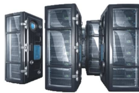
СЕРВЕР ПС "TelePay"