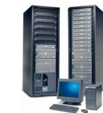
СЕРВЕР ПОСТАВЩИКА УСЛУГ